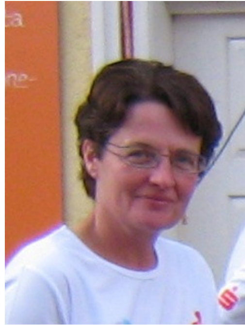
Doro lief gelassen die 10 Km mit .....