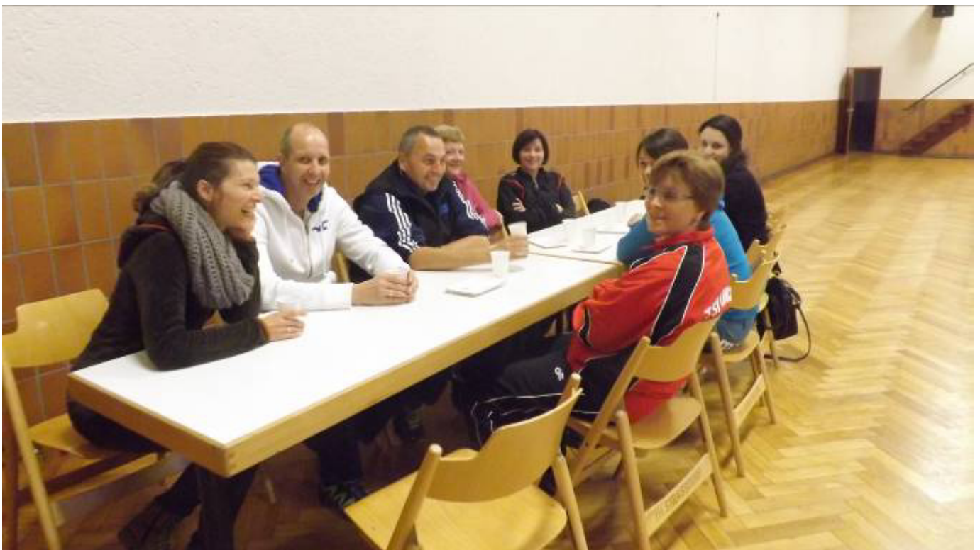
Fleißig geradelt und fleißig Kuchen gebacken ... beim Indoor Cycling Marathon kamen sage und schreibe 1010 Euro für das Kinderdorf in Tansania rein. Tausend Dank euch allen !!!