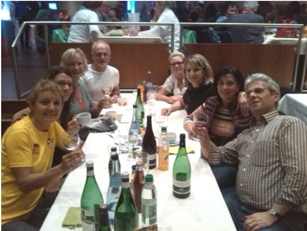
Helferfest Stadtgarten 20.10.14

Laufteam Elke hatte mal einen ganzen (heißen) Sonntag die Eingangskontrolle bei der Landesgartenschau übernommen und bekam eine Einladung in den Stadtgarten.