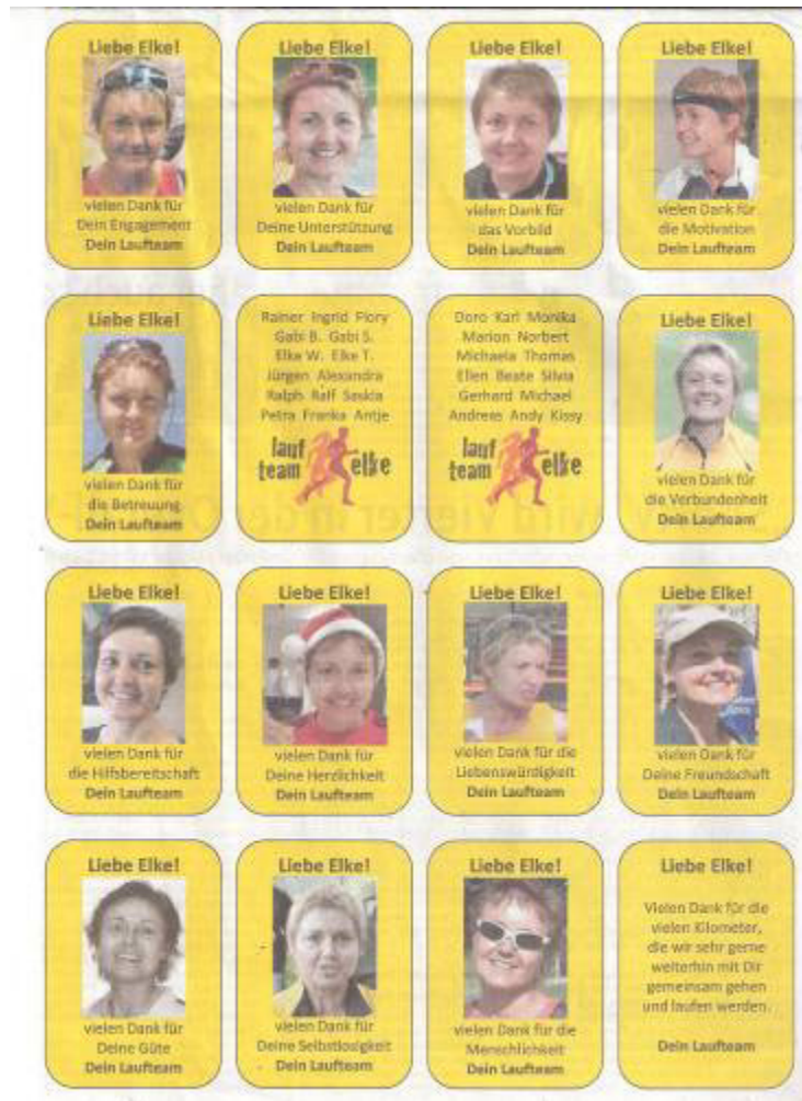
und die größte >Überraschung war diese Seite in der Rems-Zeitung..... Herzlichsten Dank an „mein“ Laufteam !!!!! Ich bin platt !!!!!