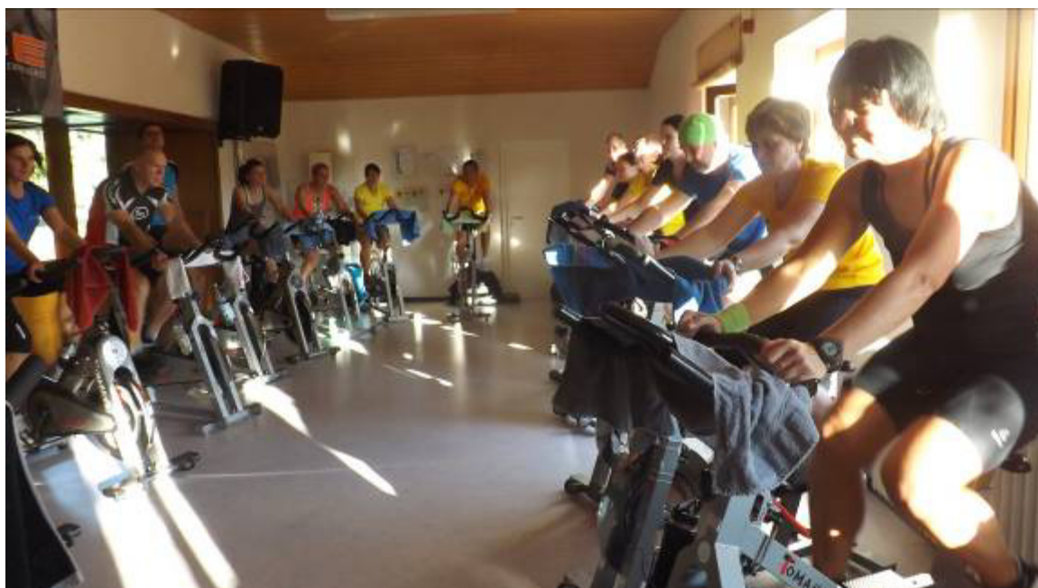
Indoor Cycling Marathon am 9.11.14