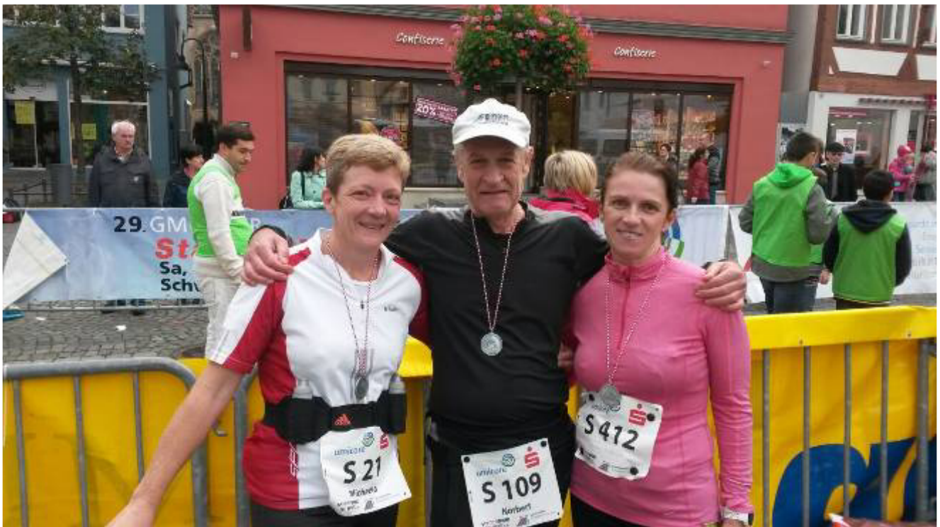
Alb Marathon am 25.10.14 mit 50 / 25 / 10 km

Laufteam Elke hatte mal einen ganzen (heißen) Sonntag die Eingangskontrolle bei der Landesgartenschau übernommen und bekam eine Einladung in den Stadtgarten.