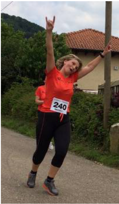
Flory freut sich auf den Fladen