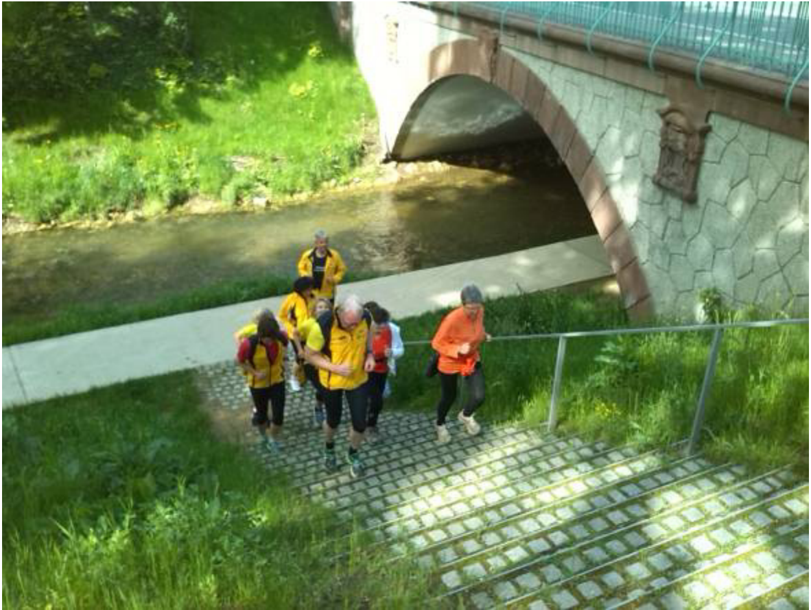
....treppauf und treppab.