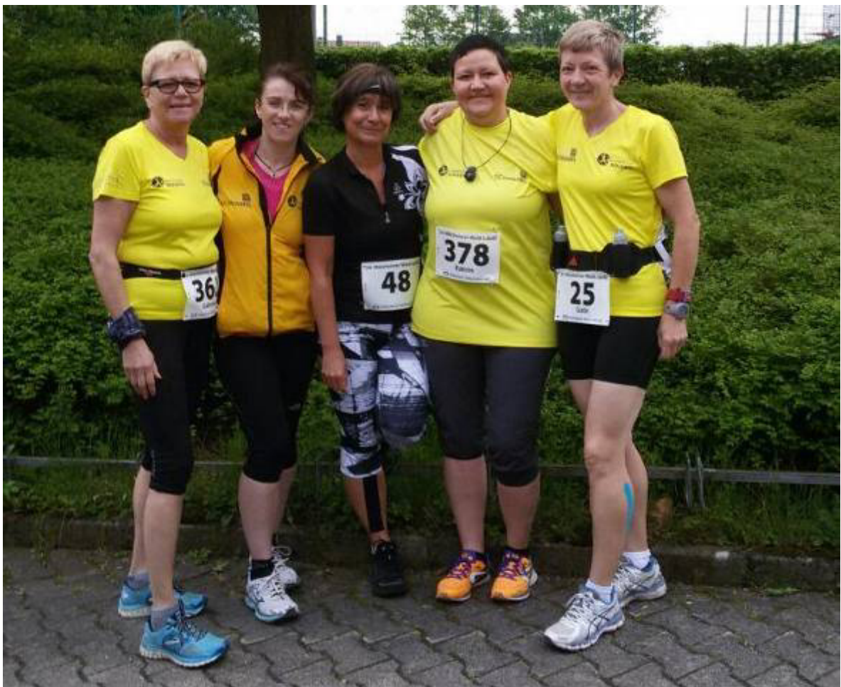
Und dann war am selben Tag der Welzheimer Lauf mit persönlichen Bestzeiten....