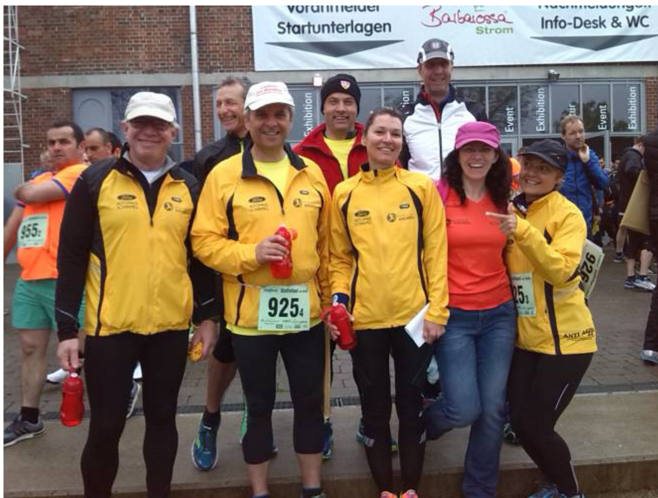
Barbarossalauf Göppingen am 3.5.15 bei Regen mit zwei 4er Staffeln von insgesamt 62 Ergebnis Platz 5 und Platz 31