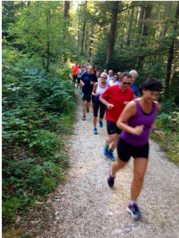
22 Läufer und Läuferinnen am Dienstag, 15. Juli in Lorch beim Training – hochmotiviert – der Remstalmarathon rückt immer näher und auch die Stafettenläufer waren mit dabei.