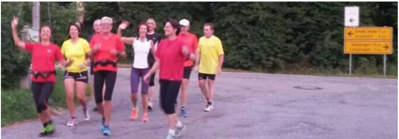
Training für den Remstalmarathon: Donnerstag, 22. Juli – große Runde über Gmünd, Trasse Straßdorf, Reitprechts - Schönbronn (Bild) und dann wieder Gmünd Stauferschule – 15 km