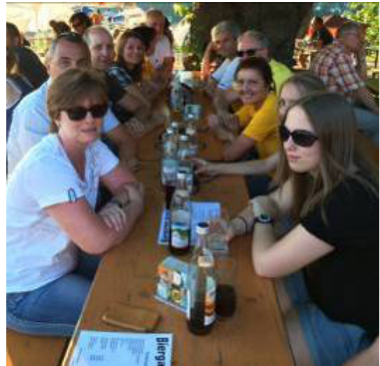
Nach 11 Stunden in der Hitze wurde auf dem Zeiselberg eingekehrt und anständig getrunken und gegessen – dazu kamen dann auch diejenigen, die statt Helfen im Freibad waren...