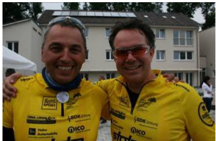
Tour Ginko 2014