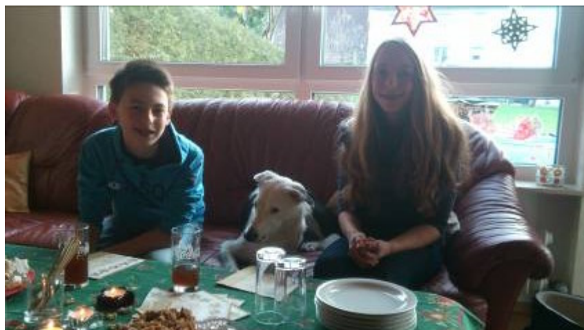
Guatsleslauf in Waldstetten mit Einkehr bei Sobls, die 2 Schrqmel-Drillinge gingen nur wegen Luna mit....