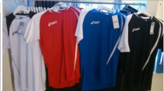
Welches Shirt solls nächstes Jahr sein – wieder gelb (diesmal von Mizuna) oder weiss / rot / blau / schwarz von asics ???? Überlegt es euch bis zum nächsten Jahr.... Bis dahin...