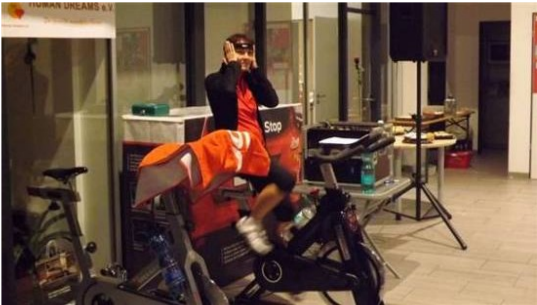
Die letzten beiden Stunden....