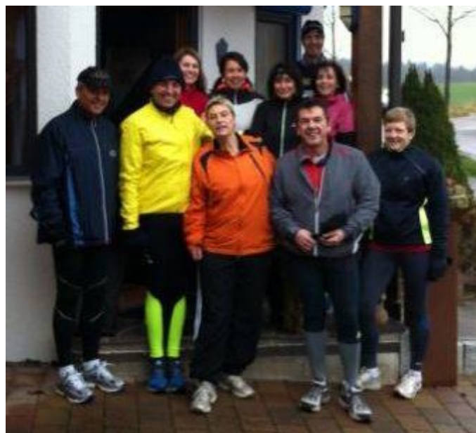
Nikolauslauf 2013 bei Tellbachs mit anschließendem Glühwein trinken...