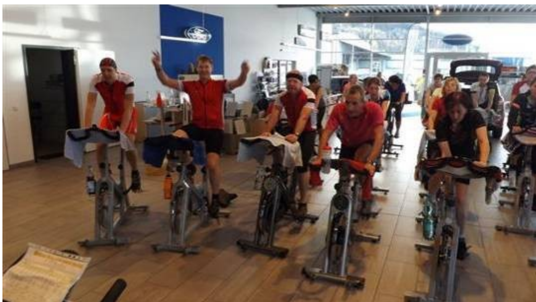
Ralle macht mal wieder Faxen ...