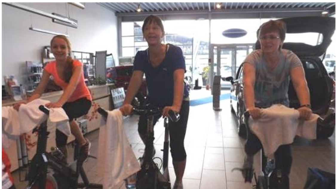
Schramel - Frauenpower